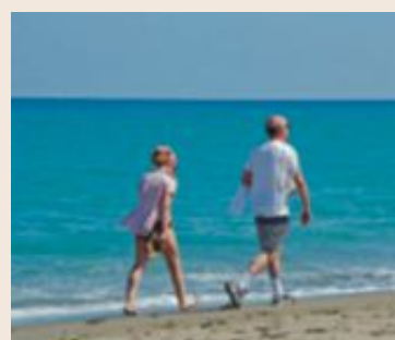
Strandliv på Costa del Sol är populärt.

I Portugal beskattas inte alls denna typ av inkomster. Allmän pension och privat pension beskattas med 20 procent. Arvsskatt tas ut med 10 procent i vissa fall. Landet saknar förmögenhetsskatt.